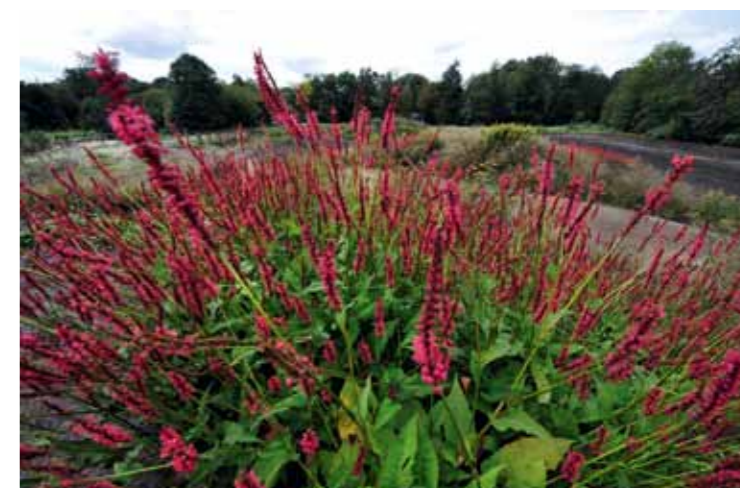
Als op termijn de wilgen ( Salix alba en Salix alba 'Chermesina') zijn geplant, zul je op de top van de heuvels over een griend uitkijken waar her en der de kleurrijke grastoppen van de andere heuvels bovenuit steken.