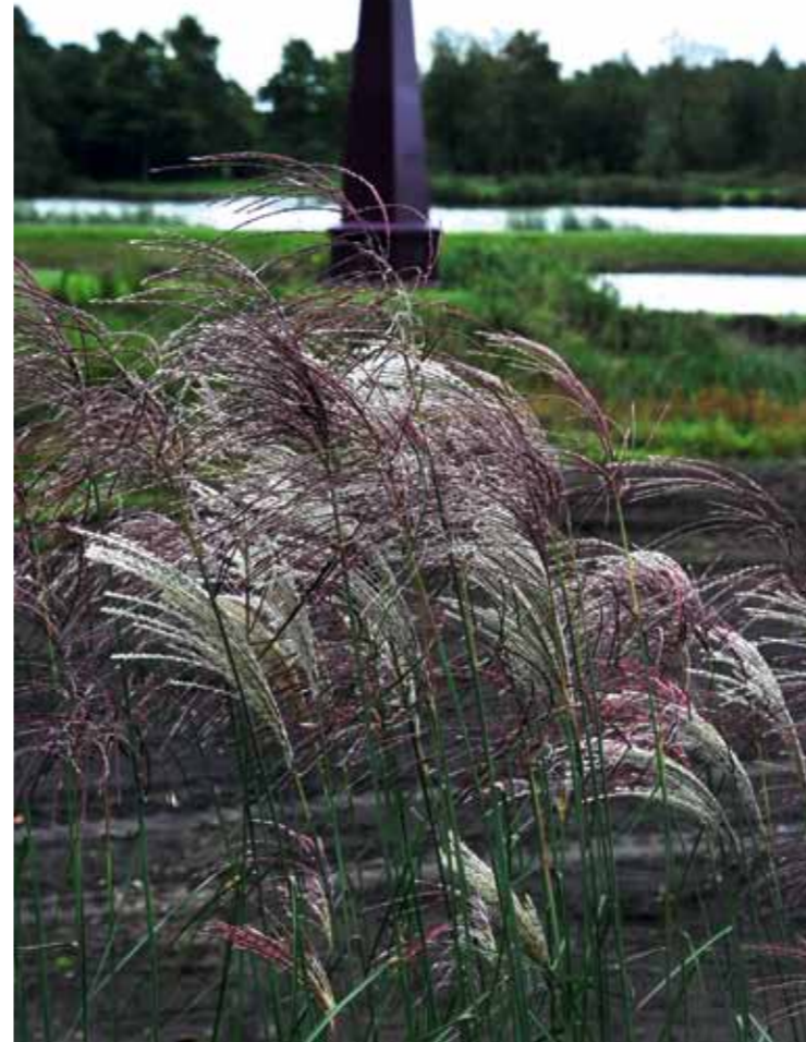
De hoge siergrassen zijn aan de oostkant van de heuvels geplant. Dit karakteriseert de ontwerpen van Oudolf. Bij de meest voorkomende wind in Nederland golven de weelderige planten op de 2 tot 3 m hoge terpen met de wind mee.

Park Vijversburg bij het Friese dorpje Tytsjerk breidt uit met ruim 31,5 ha. Er worden drie nieuwe parken aangelegd: twee van 15 en een deel van 1,5 ha waar cultuur, natuur en beleving centraal staan. De werkzaamheden worden eind 2014, begin 2015 voltooid. Vijversburg is volgens tuinhistorici uniek omdat de tuinelementen van het historische park goed bewaard gebleven zijn. De tuin is ontworpen in de Engelse landschapstijl. Mogelijk Vlaskamp en voor een deel Roodbaard hebben een bijdrage geleverd. Het in stand houden van dit park is een belangrijke drijfveer van eigenaar Stichting Op Toutenburg. Met 4,5 miljoen aan subsidies uit Europa, de provincie en de twee betrokken gemeenten is het mogelijk geworden om het cultuur- en belevingspark te realiseren. Om het onderhoud te bekostigen zal er in de toekomst een bescheiden entree geheven worden. Een jaarkaart gaat ongeveer €15 kosten en een los entreebewijs €2,50.