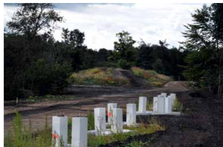
De funderingspalen voor de haag in het andere parkdeel staan klaar. Deze diagonaal snijdt door het Frijlân heen, vlak langs de hoogste terp en eindigt buiten het park als vlonder in recreatieplas de Kleine Wielen.