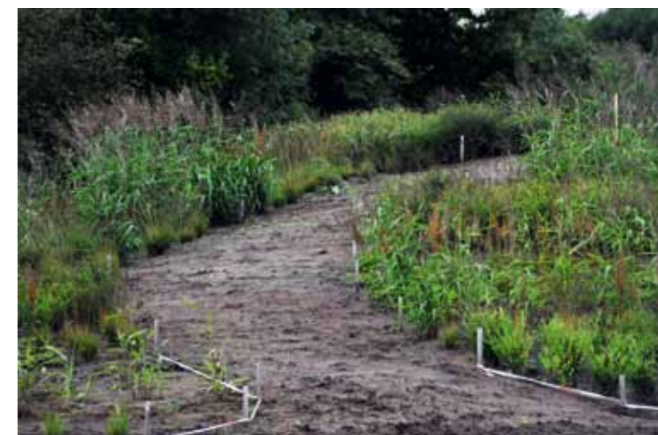
Op termijn als de wilgen ( Salix alba en Salix alba 'Chermesina') zijn aangeplant, zal er geen enkel pad in het Frijlân zijn behalve de paden op de heuvels die naar de top leiden. Bezoekers zullen zelf een weg moeten banen tussen de wilgentenen naar de heuvels.