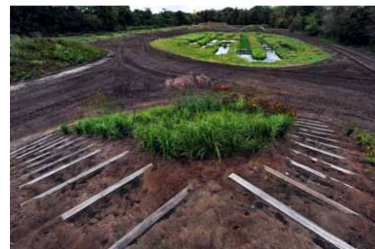
Het waterlabyrint is ontworpen door Heilien Tonckens. Na het planten van de wilgen dwalen de kinderen op een vlot door dit speelse element. Op elke plek kunnen zij instappen en ze komen altijd uit op het eindpunt: een eiland met een hangmat.